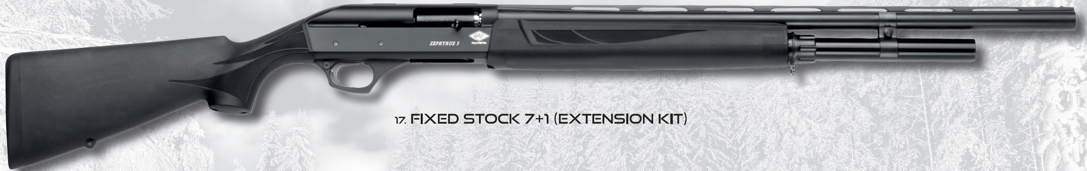
17. FIXED STOCK 7+1 (EXTENSION KIT)