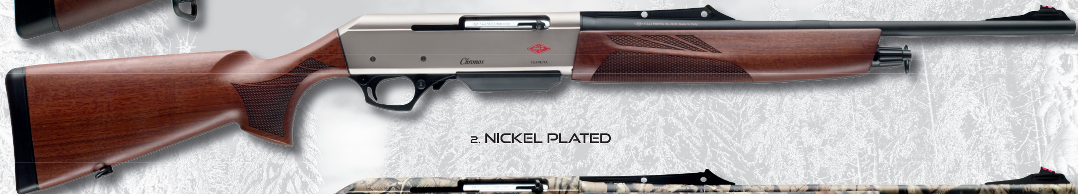
2. NICKEL PLATED