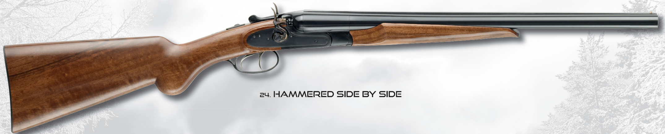
24. HAMMERED SIDE BY SIDE