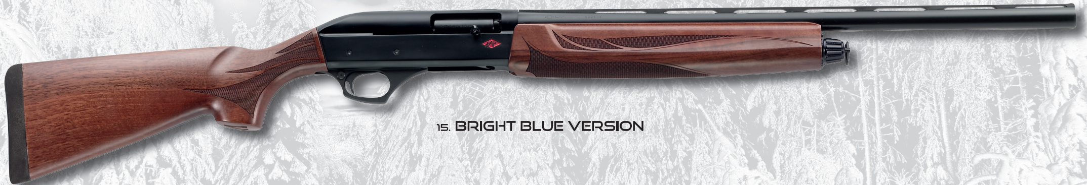
15. BRIGHT BLUE VERSION