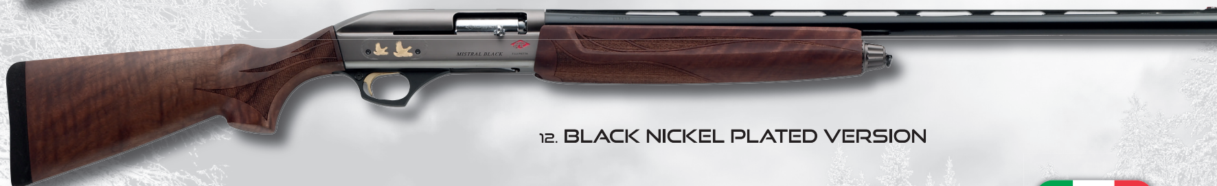
12. BLACK NICKEL PLATED VERSION