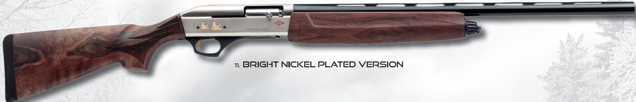
11. BRIGHT NICKEL PLATED VERSION