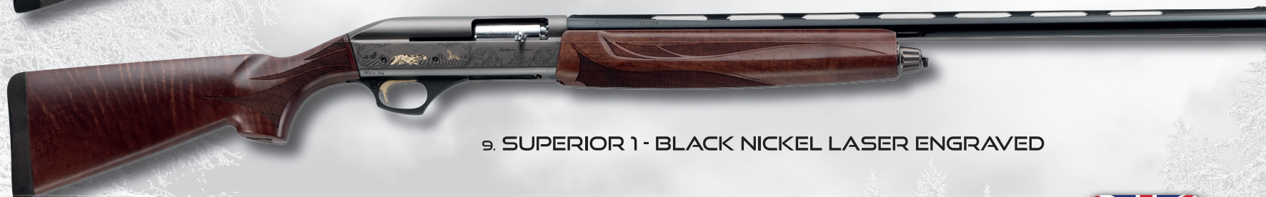
9. SUPERIOR 1 - BLACK NICKEL LASER ENGRAVED