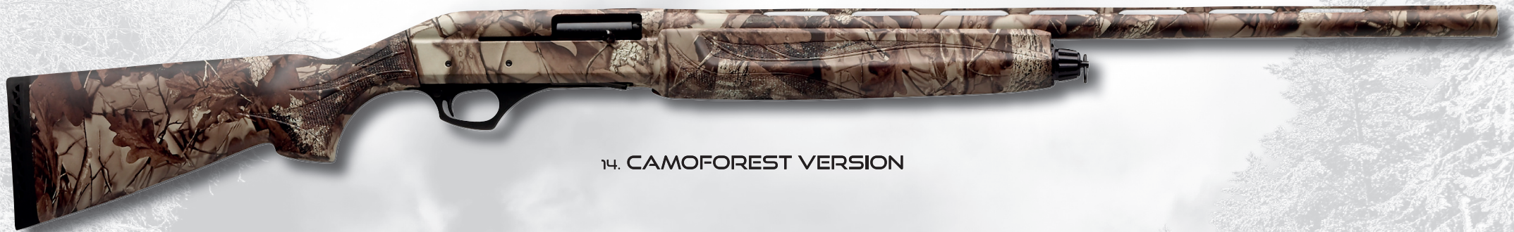
14. CAMOFOREST VERSION