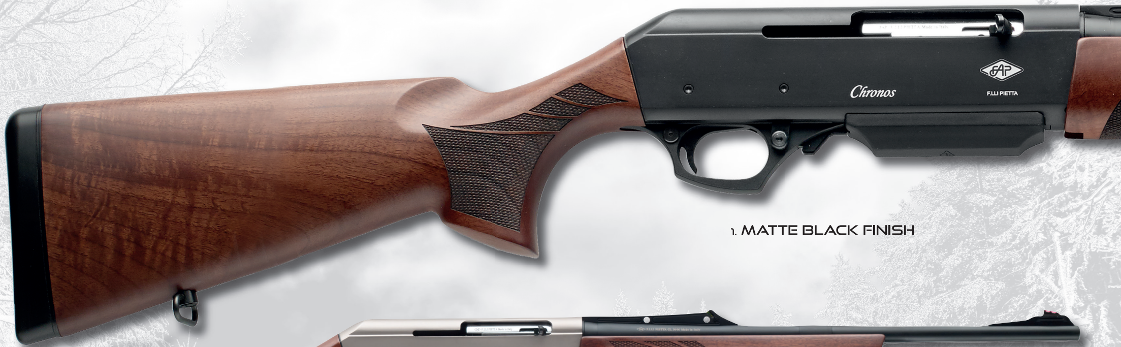
1. MATTE BLACK FINISH