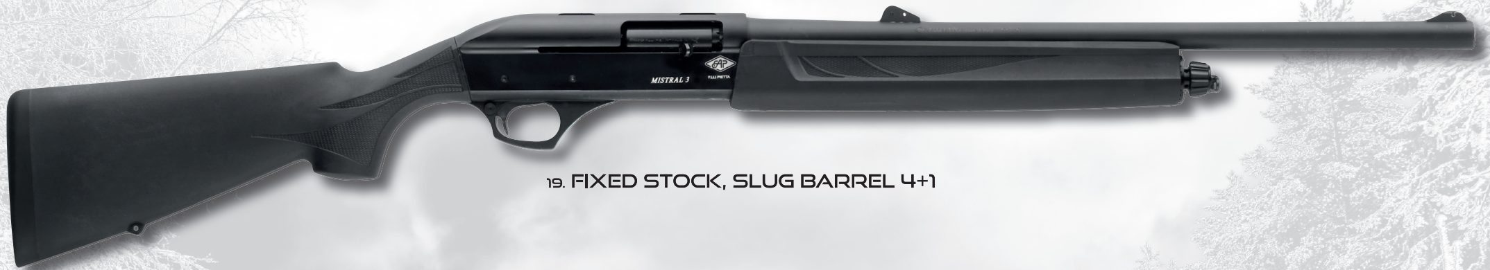
19. FIXED STOCK, SLUG BARREL 4+1