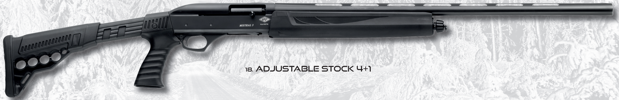
18. ADJUSTABLE STOCK 4+1