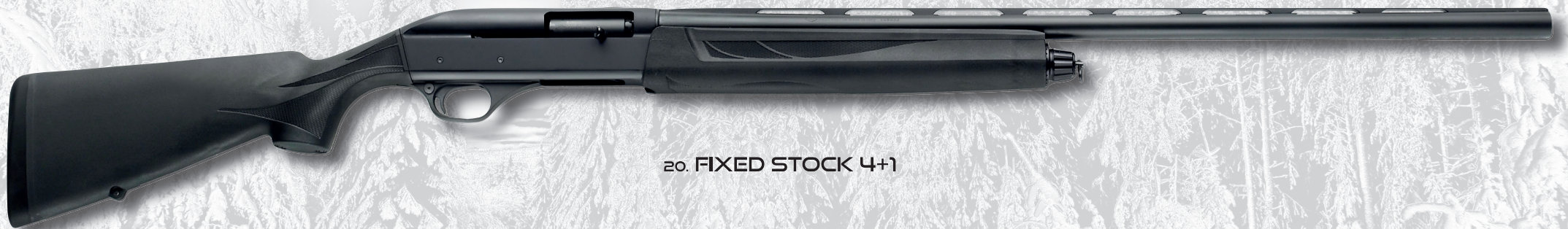
20. FIXED STOCK 4+1