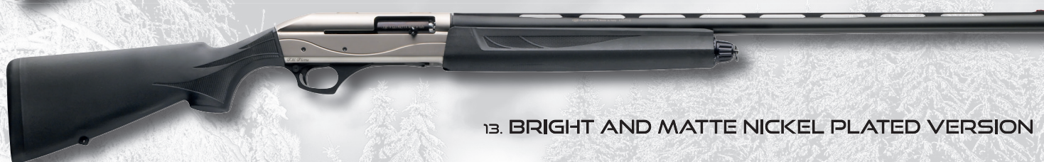
13. BRIGHT AND MATTE NICKEL PLATED VERSION