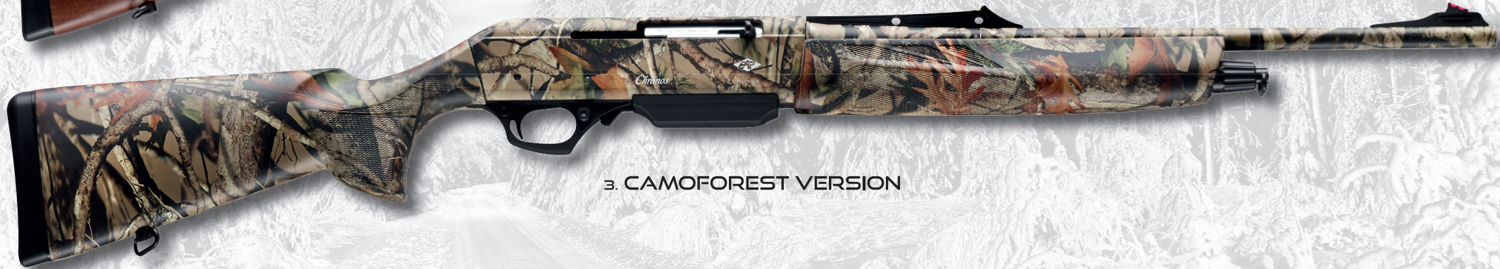
3. CAMOFOREST VERSION