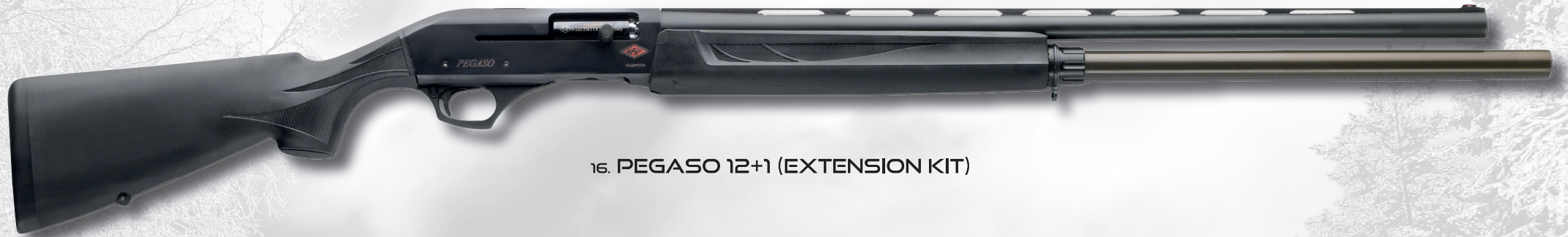
16. PEGASO 12+1 (EXTENSION KIT)