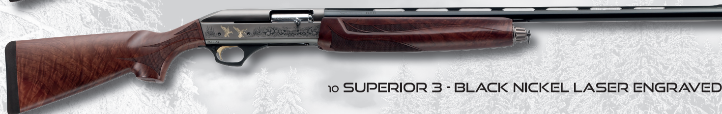
10 SUPERIOR 3 - BLACK NICKEL LASER ENGRAVED