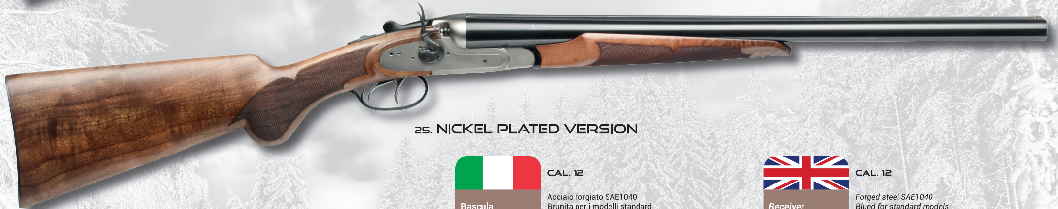
25. NICKEL PLATED VERSION