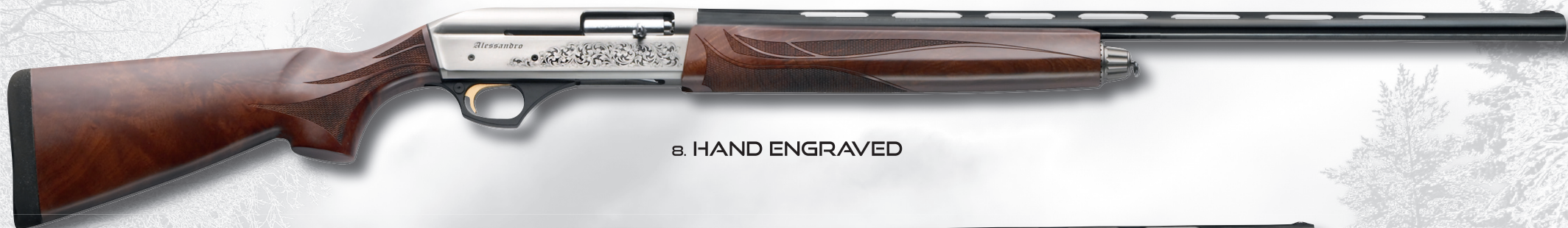
8. HAND ENGRAVED